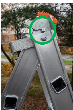
Gångjärnstappen på plats i fåran.

Försäkra dig alltid före användning att beslagen upptill på stegen är ordentligt på plats och att stegkomponenterna går genom dem