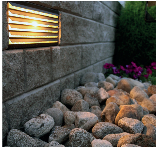
Kuva 2: Lammi Muurikivi ja muurivalaisin