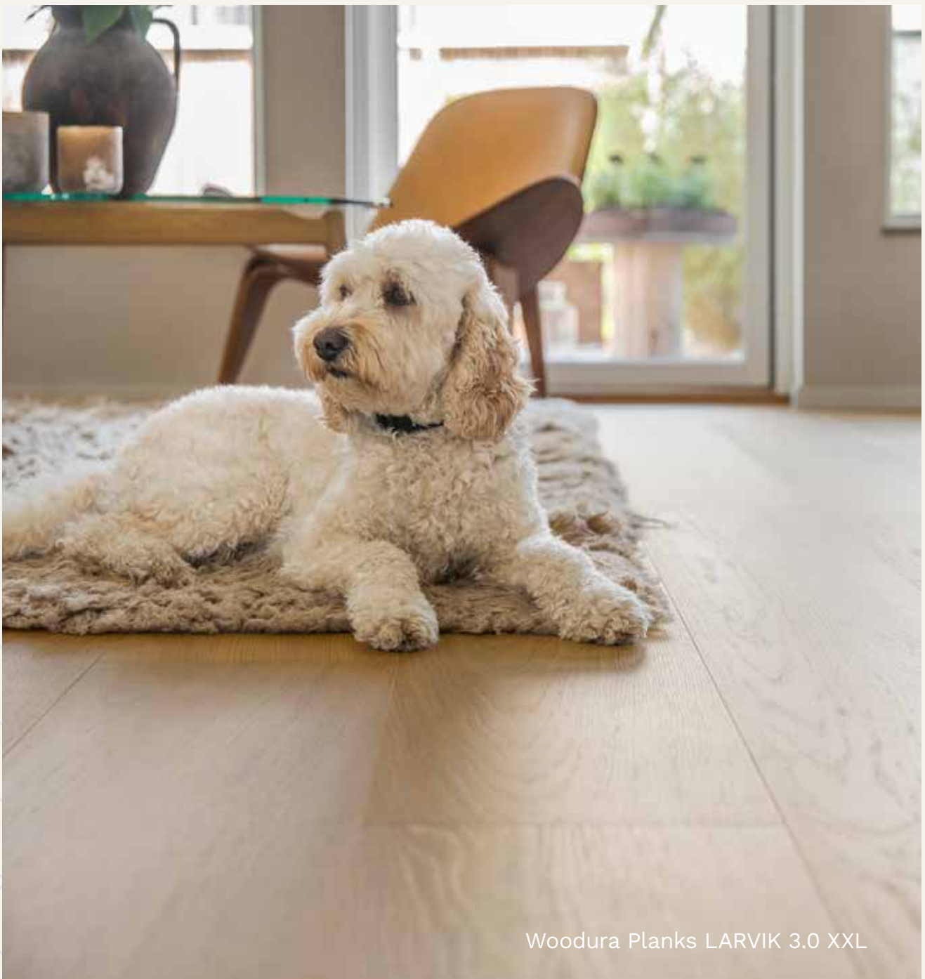
Woodura Planks LARVIK 3.0 XXL

Kuitenkin lakka tekee lattioista helpommin puhdistettavia ja hoidettavia. Valitse lattian väri sointumaan yhteen seinien ja tekstiilien kanssa tai luo kontrasteja ja tee kodista rustiikimpi luonnon syykuvioiden ja harjattujen lankkujen avulla. Suosittelemme harjattuja lakattuja lattioitamme kotiloihin.