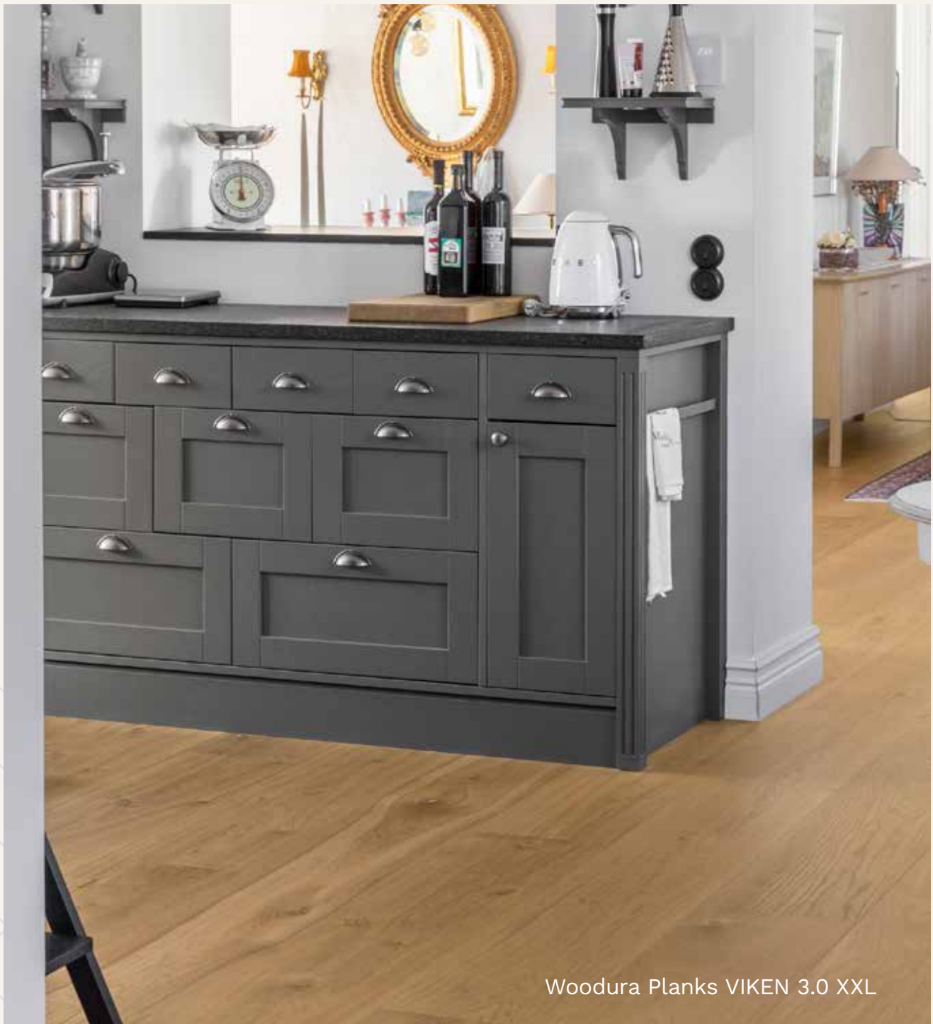
Woodura Planks VIKEN 3.0 XXL

Huoltoa vaativien ominaisuuksiensa vuoksi suosittelemme öljyttyjä puulattioita makuuhuoneisiin ja olohuoneisiin, joissa lattian käyttö on vähäisempää. Lattiat toimivat yhtä hyvin vilkkaamminkin liikennöidyissä tiloissa, mutta silloin niitä on huollettava enemmän.