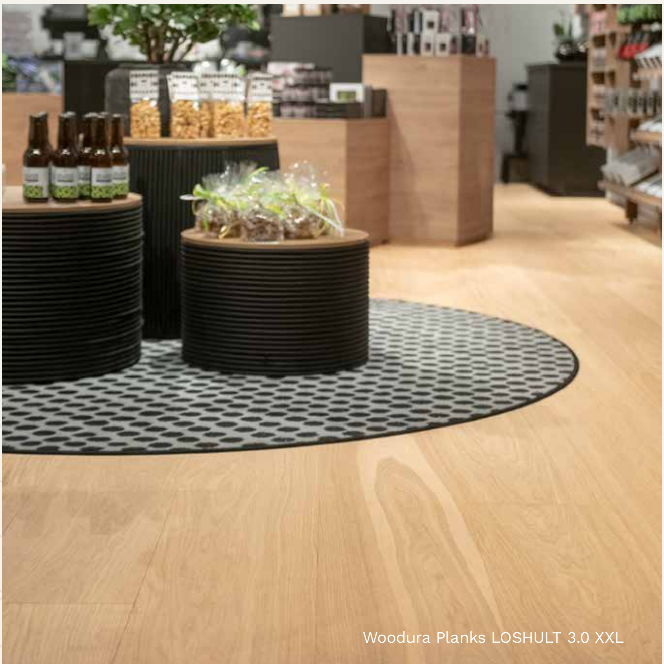
Woodura Planks LOSHULT 3.0 XXL

Kovetettuja Woodura 3.0 -lankkulattioitamme on saatavana monina eri malleina. Hienostunut värimallistomme sopii moniin sisustustyyliin - eri väreillä voit antaa modernin silauksen, ripauksen eleganssia tai luoda tyynen ja rauhoittavan ilmapiirin. Suosittelemme pro mattalakkapintaa vilkkaasti liikennöityihin kotija julkutiloihin.